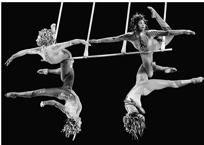
Perfekte Haltungsnoten: Vorstellung des Cirque du Soleil in Frankfurt/Main

„Die Sportler wollen, solange es geht, ihren Sport ausüben, erst danach werden wir für sie interessant“, sagt Clark. Auf keinen Fall möchte man in das Licht geraten, Turner abzuwerben. „Melde dich bei uns ein Turner aus einem Nationalteam, kontaktieren wir seinen Verband, um seine Situation dort zu klären.“