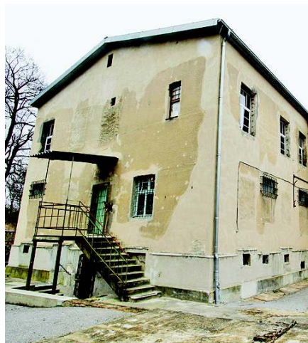
Das unsanierte Gebäude fällt auf. Es vermittelt Authentizität.

■ Ein weiterer Gedenkort ist die Gedenkstätte Lindenstraße 54: In dem seit 1820 als Gerichtsort und Gefängnis benutzten Gebäude wurden von 1952 bis 1989 politische Häftlinge der Stasi verhört, gefoltert und jahrelang inhaftiert. Die weitläufige Anlage kann dienstags bis sonntags von 10 bis 18 Uhr besichtigt werden. Tel.: (03 31) 2 89 68 03. (kl)