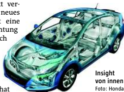
Insight von innen

„Die Umweltprämie nutzt nicht den hochwertigen Ökoautos“, sagt Toyota-Mann Wandt. Keiner kauft damit einen Prius. Der Vorzeigehybrid von Toyota (ab 25.500 Euro) spreche generell eine „andere Kundenschnittstelle“ an. Im Sommer kommt die dritte Version des Prius heraus. Mit offiziellen 89g/km CO 2 und 3,9 Litern Benzin auf 100 Kilometer stößt er dann in die Bereiche eines „3-Liter-Autos“ vor. Das Auto soll künftig nicht nur Öko-Opis ansprechen, sondern