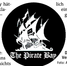
Das Logo der Verurteilten